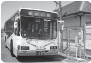
鯉沢口駅から 青洲高校前間を 結ぶコミュニティバス

答 令和3年度は、2月10日と3月17日の2回、令和4年度以降3回を予定し、答申を受けたい。