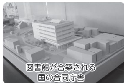
図書館が合築される 国の合同庁舎