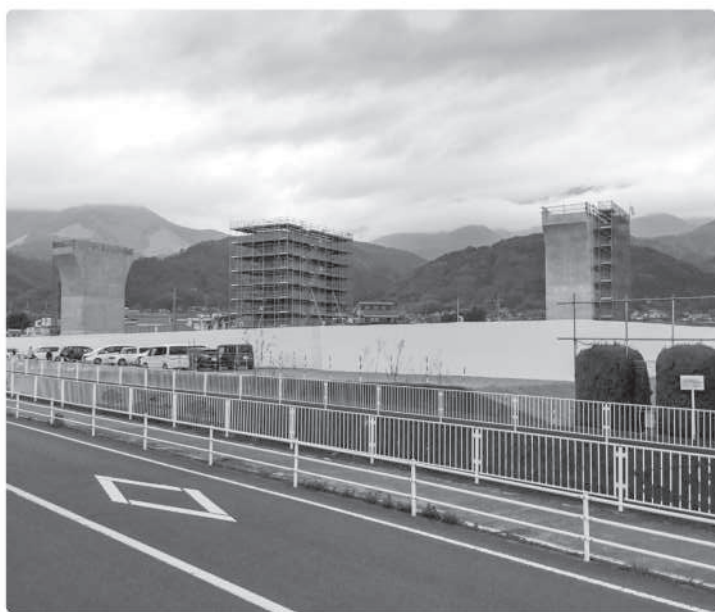
工事が進むリニア橋脚

万円、道路改良工事および舗装工事費に約8億8千万円、測量設計など委託費が約1億円で、総事業費は約13億円を見込む。