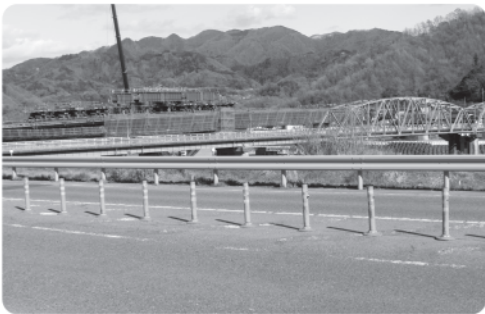
架け替えが進む富士橋