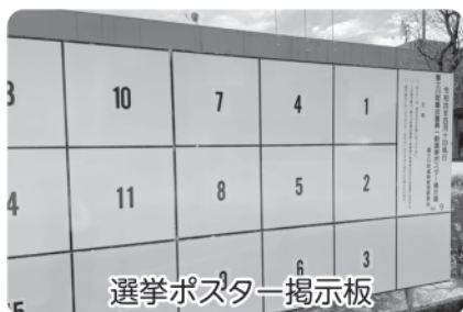
選挙ポスター掲示板