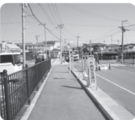
町道最勝寺小林1号線