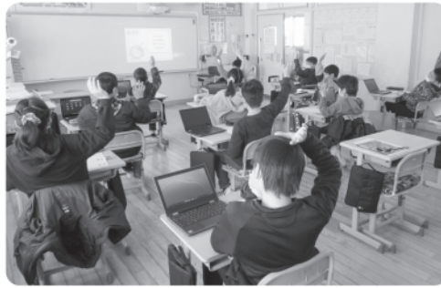
タブレット端末を使った授業風景

答 フライヤーから出る油による臭気を押さえるためにフィルターを設置する工事である。