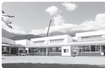
計画的に修繕を進める第1保育所

答 15年償還で、利率は0.2%から0.3%であり、利率の低い金機関から借入している。