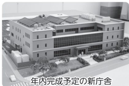
年内完成予定の新庁舎