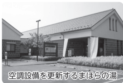
空調設備を更新するまほらの湯