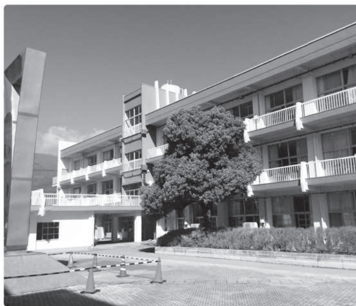
外装改修工事が完了した増穂小学校校舎 今後は内装改修工事を

き校舎を活用すれば、教育活動への影響が軽減でき、工期短縮・経費削減も図れる。校舎の活用については、統合の方向性を見極め検討していく。