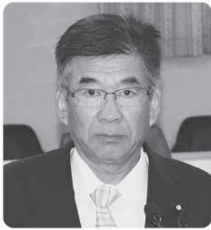
秋山 仁 議員