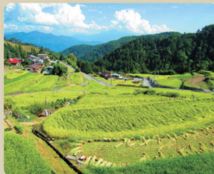
棚田の広がる美しい景色

ています。この取り組みにより移住する家族の増加や定年退職後に地域に戻り、農業を始める方も出るなど、かつて激減した人口もほぼ横ばいとなっているほか、女性の社会参画、高齢者の生きがいづくりも一層促進され、地域の活力低下を防ぐ役割も果たしています。組合では「美しい農村景観」「農業体験」「農産物販売や地域食材を使った料理の提供」など、平林を訪れる方々に「第二のふるさと」と感じてもらい、交流や定住が促進されるように取り組んでいます。