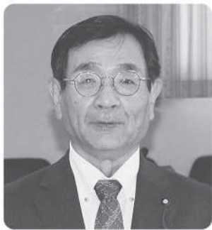
望月 眞 議員