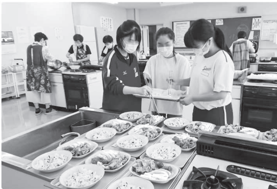
食事の提供で子どもたちに支援を（子ども食堂）

町長 困っている人がいる。一方で何とか支援の手を差し伸べたい。できることはやっていきたい。全ての人が居場所と出番がある。そういう町づくりを進めていきたい。町でも施設の検討など、さまざまに検討を進めながらひとづくりの町へ一步一步進んでいきたいと思っている。