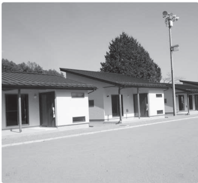
農林業体験交流宿泊施設（平林・旧西小跡地）

問 統合について禍根を残すという発言があったが。 町長 保護者への説明不足があったということである。