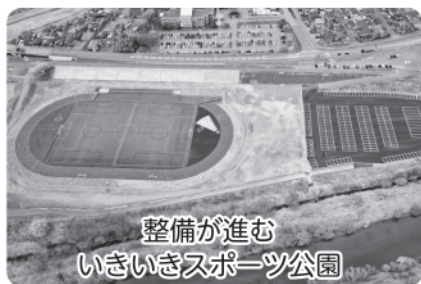
整備が進む いきいきスポーツ公園