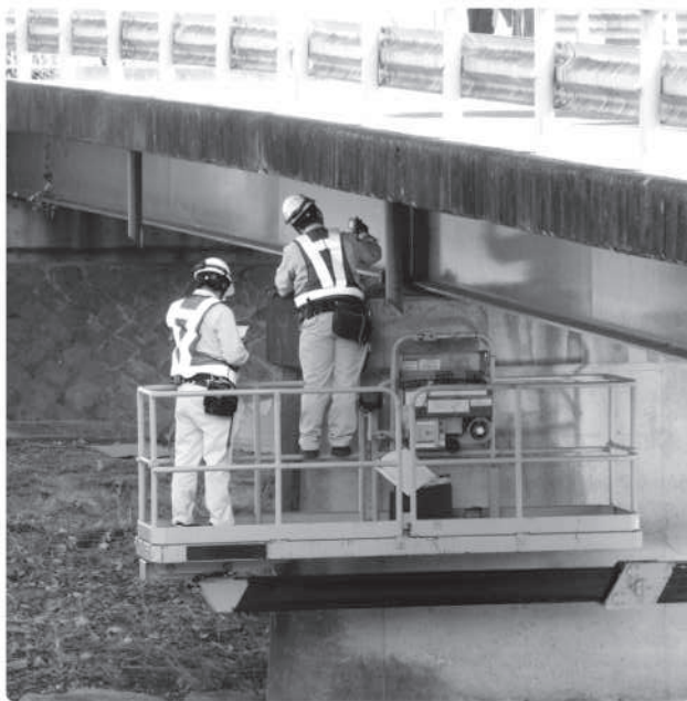
損傷は軽微なうちに修繕工事を行う