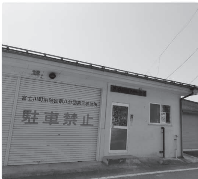
団員の処遇改善に期待（統合される第8分団）

子育て支援課長 平成9年度生まれから今年度高校1年生までの方は、令和7年3月までの3年間、接種が可能となった。