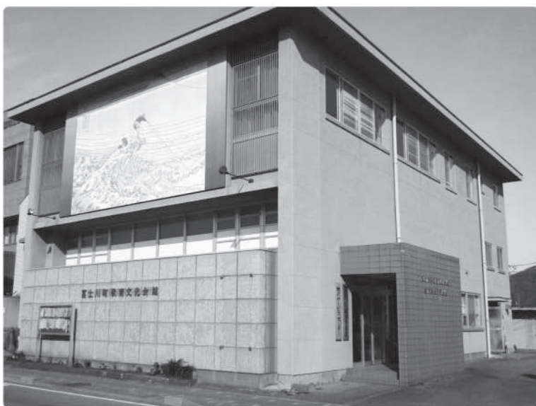
現在使用中の教育文化会館