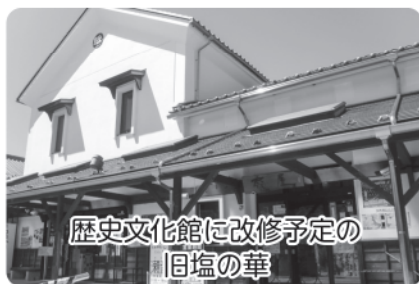
歴史文化館に改修予定の 旧塩の華