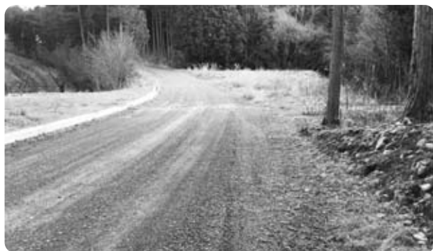
継続的の工事が必要となる平林伊奈ヶ湖線