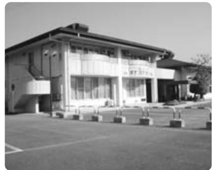
解体される「ますほ児童センター」