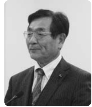
望月 眞 議員