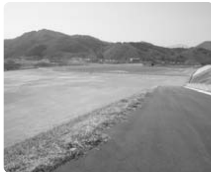
供用開始した「いきいきスポーツ公園」