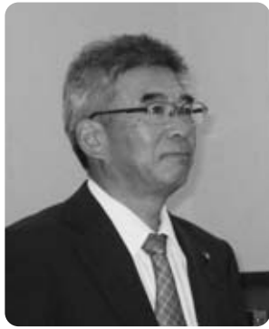
秋山 仁 議員