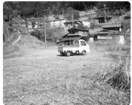
「十谷大型バス駐車場」用地