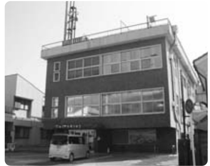
役目を終えた「分庁舎」