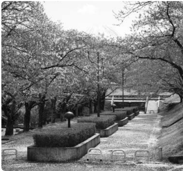
満開の殿原スポーツ公園