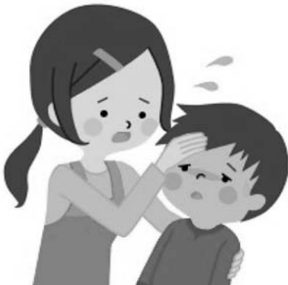
迅速な対応でリンゴ病などの感染症の拡大を防止したい

供が必要な疾患となっている。 問 感染症に不安を抱いている方の町への問い合わせ先は。 福祉保健課長 町のホームページでは感染症情報についてのページに掲載してい