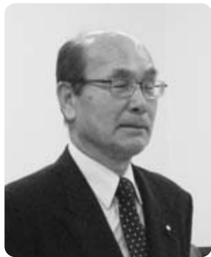
成田 守 議員