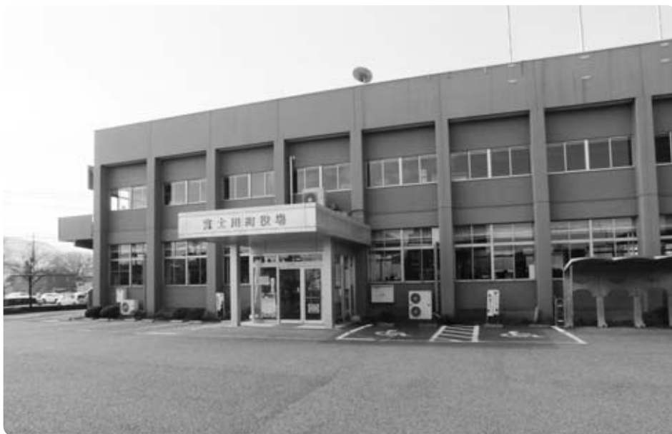
7大事業により町の財政はどうか

地方財政計画に基づきながら予算編成し、運営している。町の財政も決して楽な財政状況ではないが、財源を確保する中で、将来の子どもたちのために、できる限りのことを行いたい。