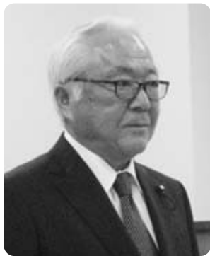
秋山 稔 議員