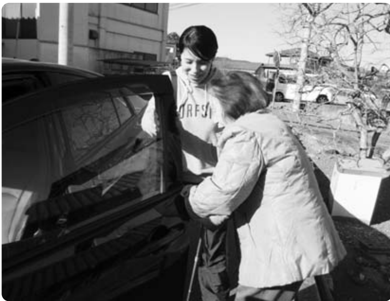
一層の生活支援員の増員が待たれる

今後は生活支援サポーターを含め、ボランティア養成講座を増やし、サポーターを増やしていく。今後は社会福祉協議会において月一回、定期的に講座を開催し、生活支援サポーターや災害ボランティアなどの養成を行っていく。 問 日常の困りごと相談、