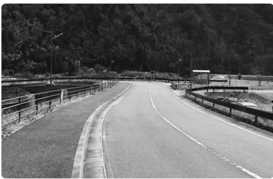
早期着工が望まれる鹿島落居トンネル予定地

ただいている。鹿島落居トンネルは、物流・地域間交流・救急医療・防災面からも必要と考える、今後もひとつずつ積極的に解決していき、早期着工を要望していきたい。