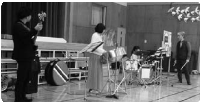
ゆずっ子文化祭(増穂南小学校)