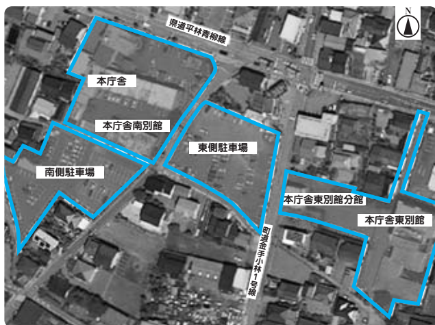
新庁舎整備の敷地、このどこに建てられるのか