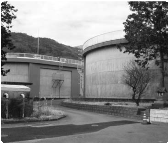
深い井戸から汲み上げた良水。タンク2機で容量は計4千ト