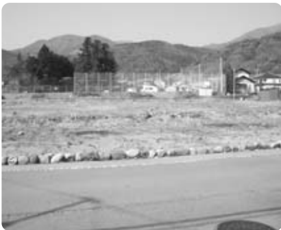
「学校給食センター」建設地