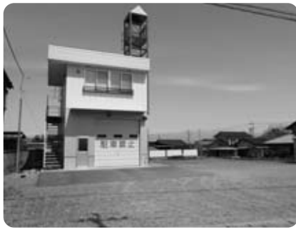
第1分団詰所(天神中條区)