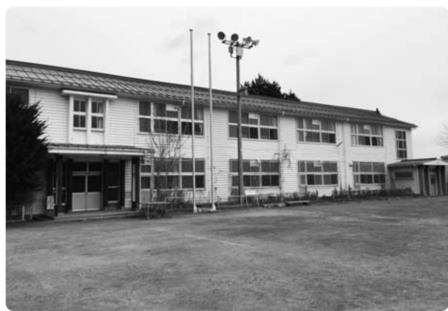
民間に譲渡した旧増穂西小学校

問 旧増穂西小の土地と建物を民間に譲渡し、昨年8月には体験宿泊など事業開始の計画だったが、なぜ未着手か。 政策秘書課長 「株式会社氷室の里」へ売却後、平林区から、町が仲介して三者協定の締結を依頼された。