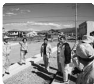
町道大柵大久保線用地