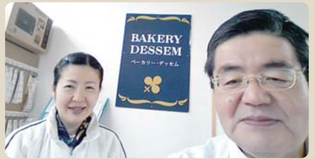
なごやかな職場ですが、パンづくりには厳しい

最も重要なのは実は「空気」なのです。富士川町は福島原発から直線距離で330Kmあるので、安心してパン作りができます。私のパン屋「デッセム」は「無添加＝あらゆる化学合成物質を使用しない」が信条です。さらに現在は、自家製自然酵母を作る場合に富士川町のブドウ、トウモロコシ、平林のトマトなどを使用しております。富士川町はパン作りにも、住むにも天国です。