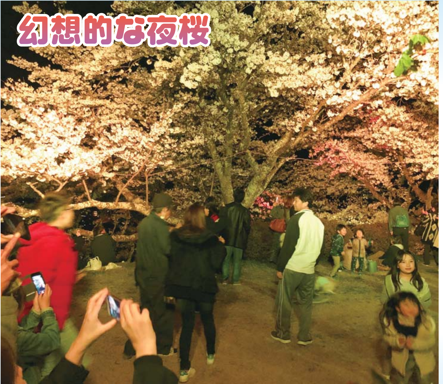
ライトアップされた大法師公園