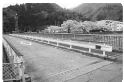
補修される開柳橋(五開区)