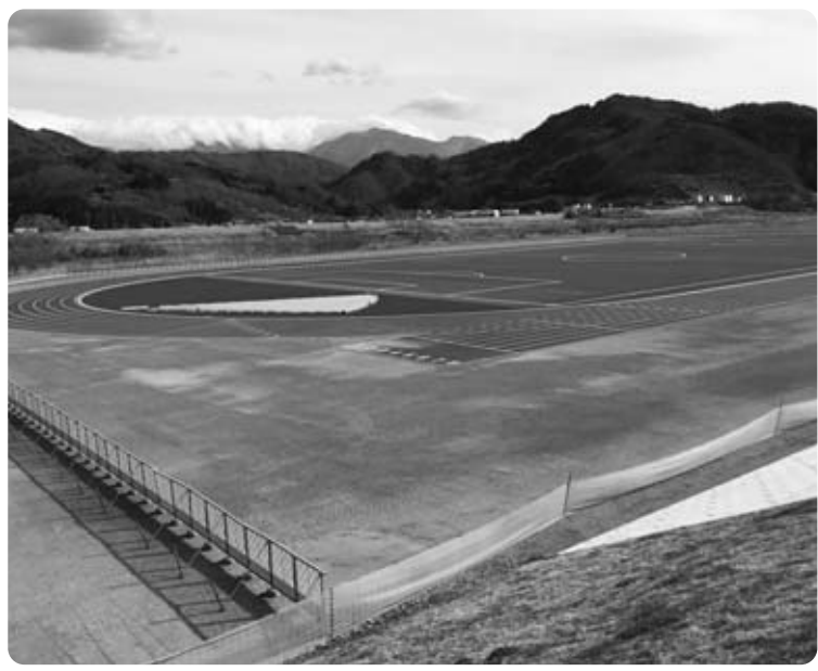
憩い交流の場としても期待の「いきいきスポーツ公園」