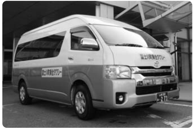
富士川町乗合タクシー(デマンドバス)

問 町内のタクシー事業者が「ユニバーサルデザインタクシー」を導入する際に、補助する制度をつくったとの報道が