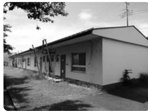
リニア建設により解体される殿原団地