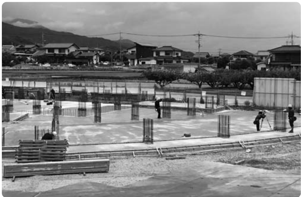
進む新児童センター工事

問 新児童センターについて、6月号の広報に「約7億円で完成を目指す」とあったが、概算10億円の計画に対し、何を削減できたのか。