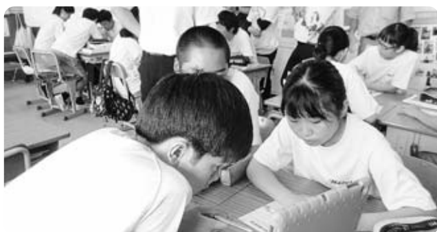
タブレットを使った授業(増穂中)

答 65歳以上の方の接種に対し、県外の医療機関等、契約外の医療機関で接種した人の償還分である。