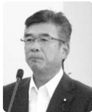
秋山 仁 議員