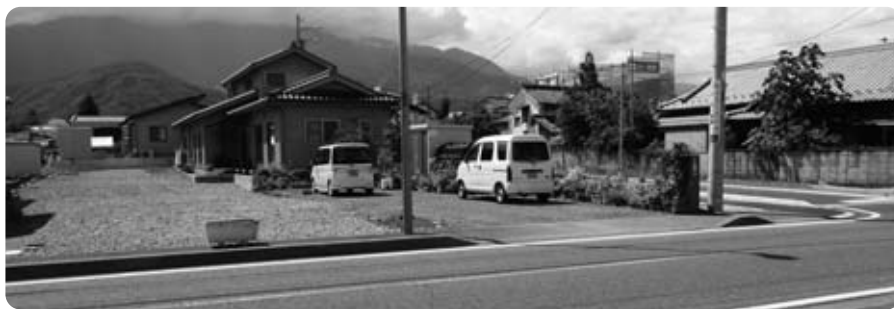
土地開発基金から購入する町道青柳10号線南側の土地

た町道青柳10号線南側の土地395・64㎡を普通財産として売却するため、土地開発基金から購入する費用である。