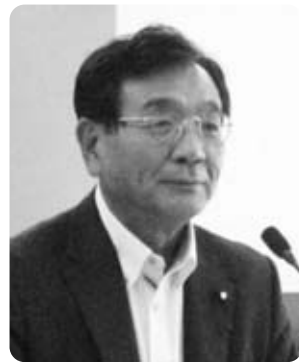
望月 眞 議員