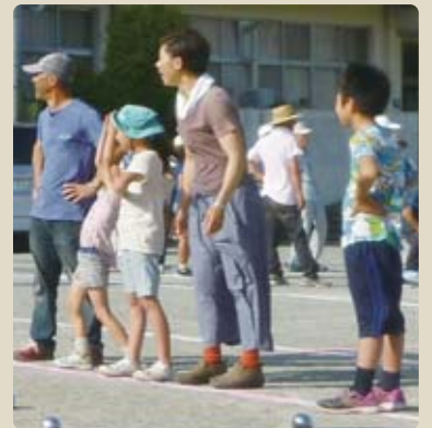
◇夫婦と中学生の長男・次男 小学生の長女・次女の6人家族。

穂積地域にかかわらず、そこに住んで生活している人々が快適で窮屈でない生活ができる素敵な場所であれば、住みたいと思う人が集まると思います。存続させていくのには、比較的若い世代が心地よく過ごせ、ほどよく地域と関わりながら子育てできる環境が必要だと感じています。