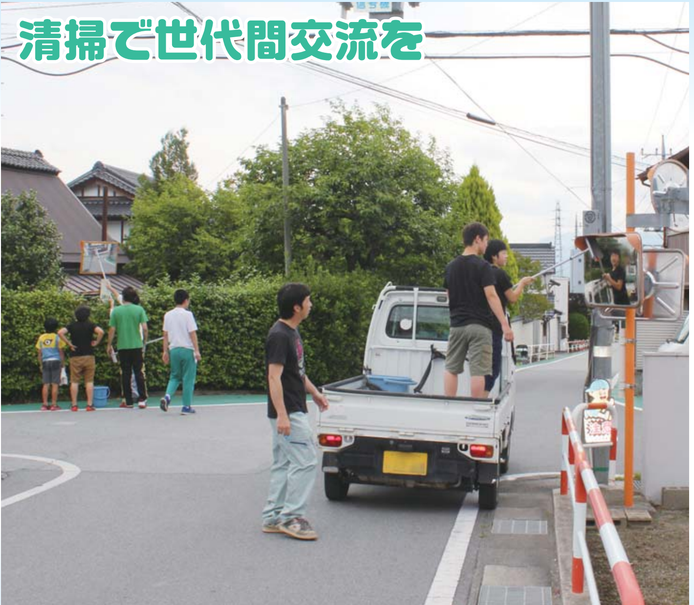
大久保区の公民館運営委員会環境整備活動