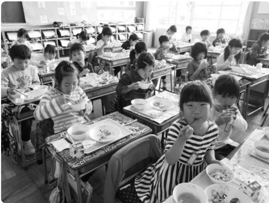
給食おいしいよ(増穂小児童)

問 6人に1人が貧困の時代だという現在、義務教育課程である小中学校の給食費の完全無償化を進めるべきだと思う。そうすることにより先生方の給食費の集金に費やす労力を子どもたちに向けてもつことができ、さらに定住促進にもつながる