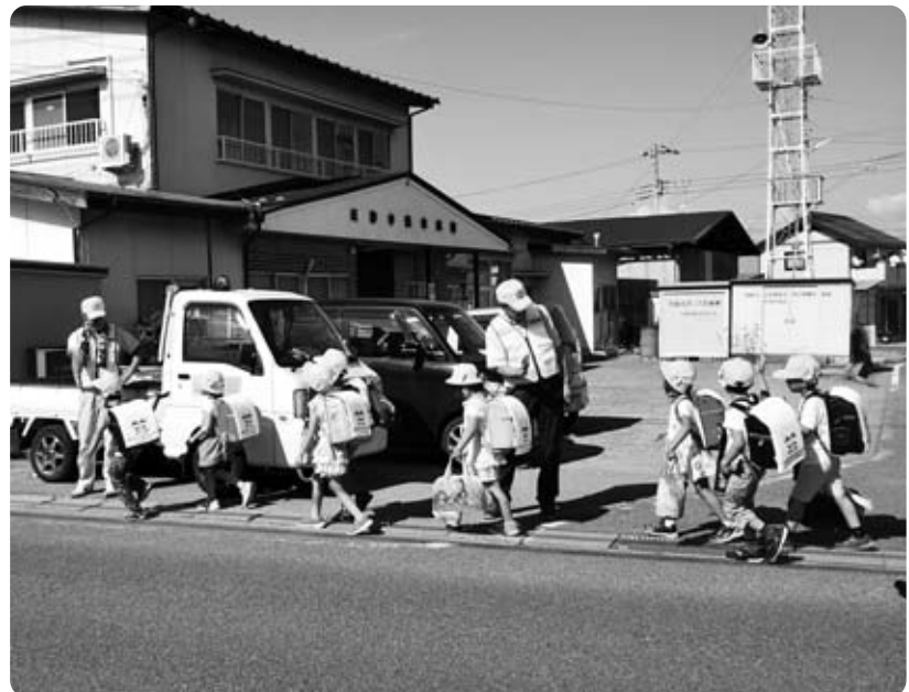
子どもたちを優しく見守る眷米駐在所安全パトロール隊

問 「眷米駐在所安全パトロール隊」のように、その他の駐在所エリアでも警察署と連携した見守りができないか。 防災課長 幅広く組織化されるよう、警察署とも協議、相談していく。