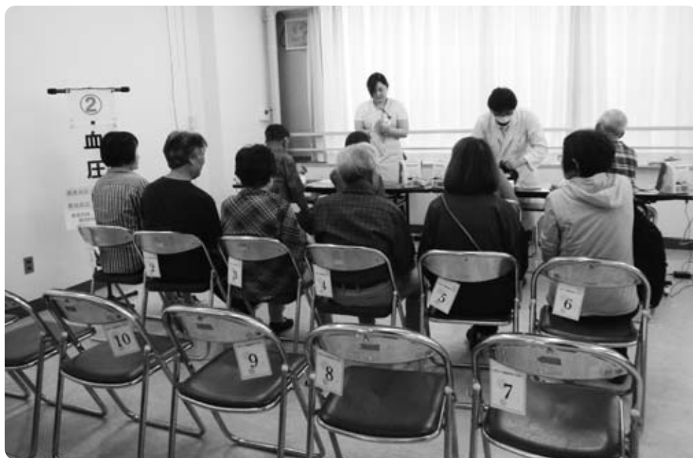
町民会館での健診風景

問 現在総合健診を山梨県健康管理事業団に委託しているが、地域医療の体制充実に変更できないか。富士川病院 福祉保健課長 現在、町内