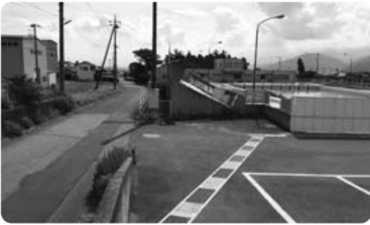
利根川公園トイレ設置予定地

答 鯉沢白子地区の朝市会場で使用していたユニットトイレを、利根川公園内のテニスコートとプールとの間の駐車場北側に移設する。