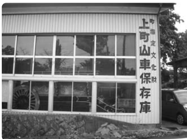
鵜沢上町の山車保存庫

台・合計120台。プロジェクト1鵜沢小2台・増穂中3台の合計5台。5力年計画で3・2人に1台の予定である。