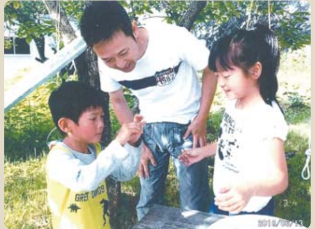
幸せな家族に恵まれて

④ 富士川町に来て4年ほどは田んぼをお借りして、少しばかりですがお米作りをしていました。恵まれた場所にいますので、近いうちにまた自分でお米作りをしたいです。