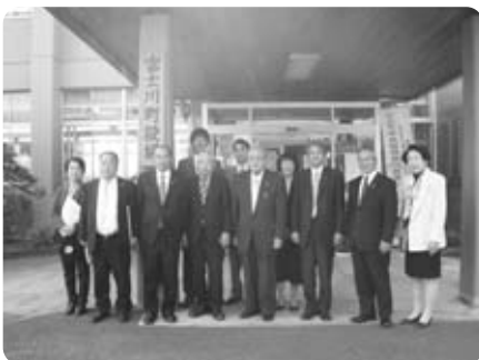
栃木県野木町議会