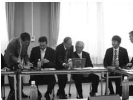
タブレットの操作体験の様子 (長野県御代田町議会)

ICT推進部会 (タブレット端末を活用した議会運営) ICT推進部会では、今年度は8月に甲州市、10月に栃木県野木町、11月に長野県御代田町、北杜市、茨城県美浦村の先進地視察として、5つの自治体の研修を受け入れました。