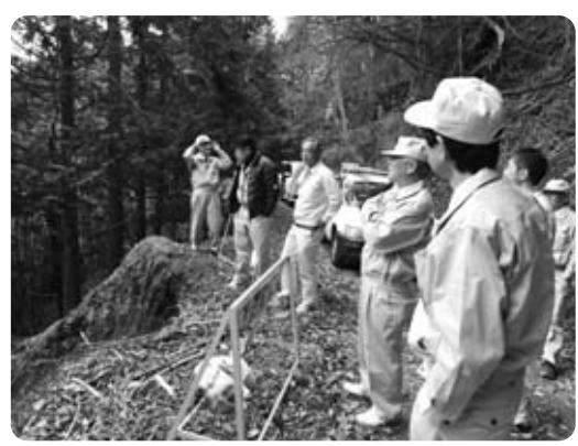
台風の猛威（五開区）