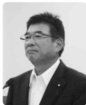
秋山 仁 議員