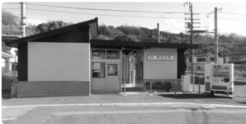
閑散としたJR鯉沢口駅前