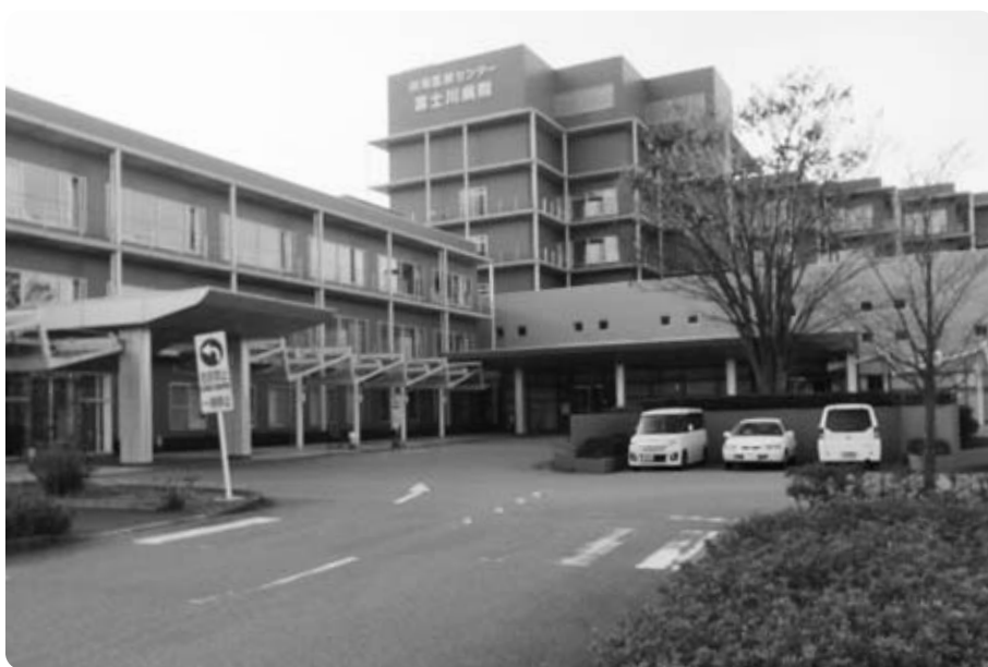
今後も町の支援が必要となる峡南医療センター

問 峡南医療センターへの今後の町の支援体制は。 福祉保健課長 現在、財政支援として負担金と貸付金の支援をしている。地域住民の健康と命を守る上で重要なのは欠かせない病院と老健