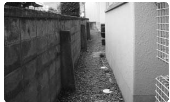
設置後約50年が経過したブロック塀（鰺沢小）