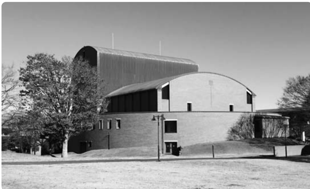
冬晴れの文化ホール

ただくので、収入・公演料で毎年動く。一定額を示し、ニーズに応じた公演ができるように権限を渡している。