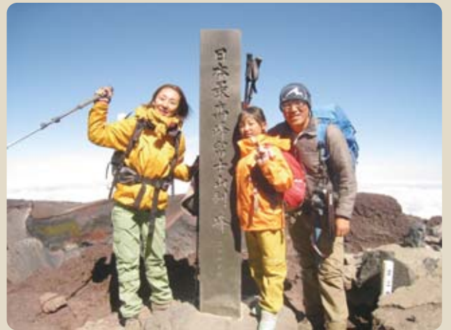
篤史さんは山岳ガイド、娘は5年生です

るように感じています。そして、皆さんにぜひ平林に遊びに来ていただきたいです。夏は涼しく、冬の富士山は美しいです！