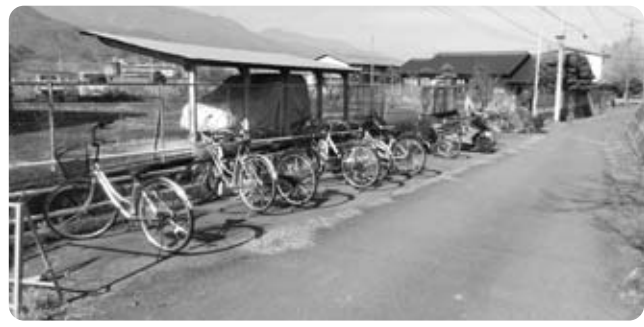
町道脇に駐輪された自転車

問 駅構内や周辺地に、富士川町の案内板を設置できないか。 産業振興課長 駅構内やJR敷地内への案内板の設置は有料であり、周辺には町有地も存在しないことから、現段階での設置は難し