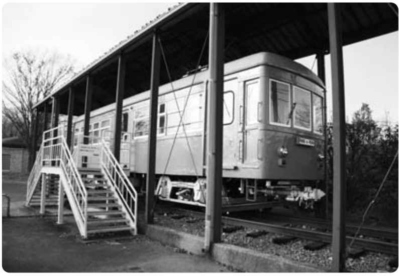
ボロ電の今昔物語

問 利根川公園に展示してある山梨交通「ボロ電」を、道の駅富士川に移転して観光資源の活用には、山梨交通か 都市整備課長 昭和61年6月に設置し、平成4年には廃止から30年の記念式典を開催した経緯があるので、現在の場所で常設展示を継続したい。観光資源に活用するには、山梨交通か