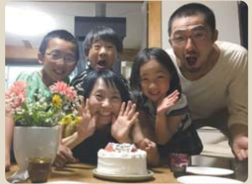
家族と共に生きながら「生きる」を探求する製作をしています

④ 工房では、彫刻と家具を製作しています。彫刻は樹の節穴がメインモチーフ。来春完成する町の児童館にレリーフが入ります。家具製作はご予算に応じて構法や材料をご提案しています。展示室を併設していますのでご見学にどうぞ、砂袋へ。