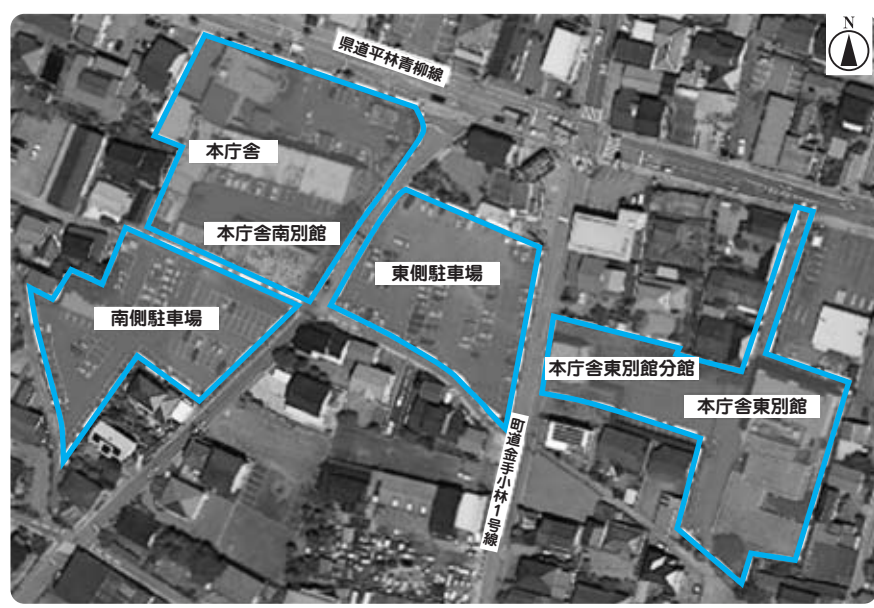
基本計画で示された新庁舎整備の敷地

で、この事業に掛かる経費は返済額の平準化や世代間の負担公平などにより、住民サービスに影響を及ぼさないよう、地方債を利用する。 問 消滅する自治体として富士川町が上位にランクされているが、町は何か対策を考えているのか。 町長 人口が減ったから消滅した団体はない。そういう事態になった時に、住民皆で知恵を出して次の方策を考えていく。 問 新庁舎建設計画の現状は。 管財課長 今後、プロポーザルにより設計者の選定を行い建設基本設計を行っていく。 問 新庁舎は現在の敷地内であるという説明ばかりで、その中のどこというのは決まっていまいかという回答ばかり。新庁舎検討委員会の答申が全て決定なのか。 管財課長 プロポーザルによる設計者が、富士川町に必要な新庁舎の提案を行い、