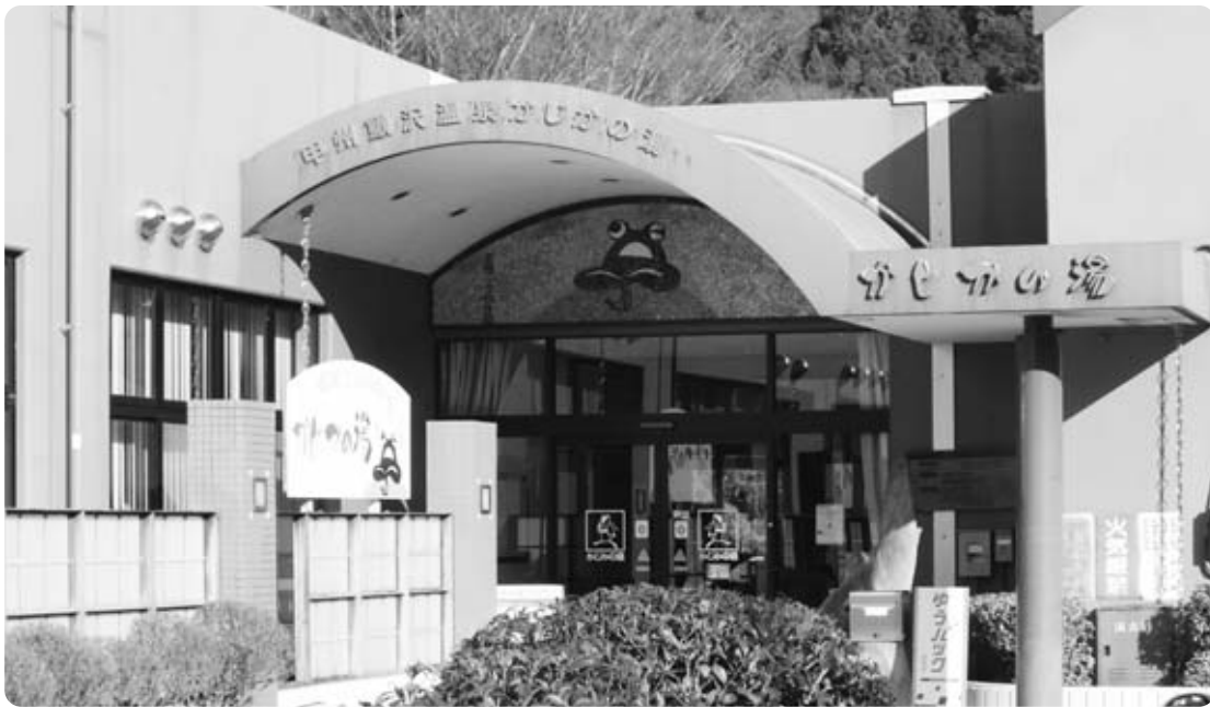
直営になったかじかの湯