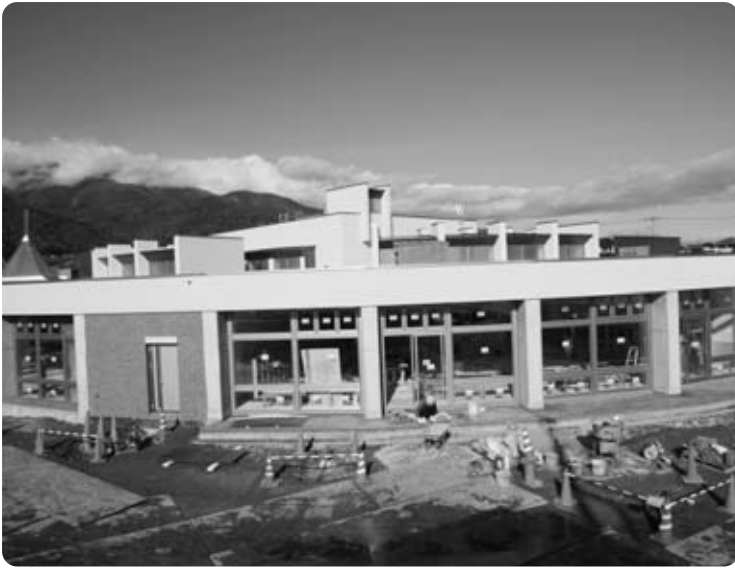
完成間近な新児童センター

問 まずは児童センターへのＪＲ東海の補償内容は、子育て支援課長 まずは児童センターの補償は、その機能を廃止したり、中断したりできない公共施設のため、公共補償基準に基づくと公共補償であり、現在ＪＲ東海と協議中である。この公共補償とは、公共施設に対する損失の補償であり、財産価値の減耗分を除いた