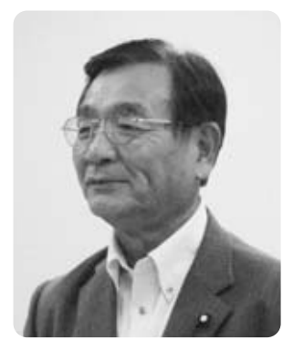
望月 眞 議員