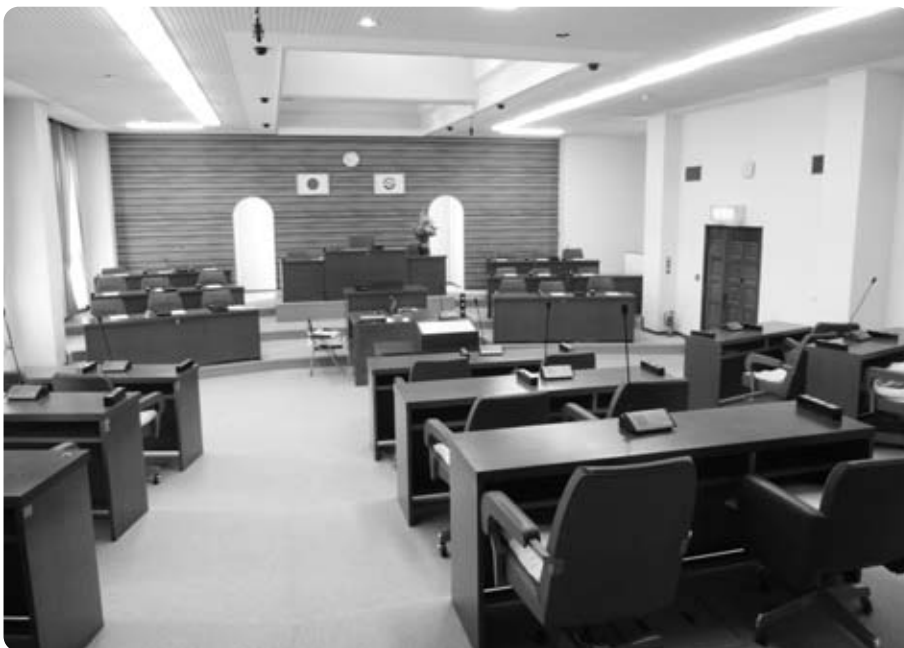
年間で20日ほどしか使用しない議場

長である。町長が私的な考えを言えば根幹が揺るぐ。保育所や小中学校も老朽化が進んでいる。全部はできないが苦しい中であってもやるべきことは実行していく。