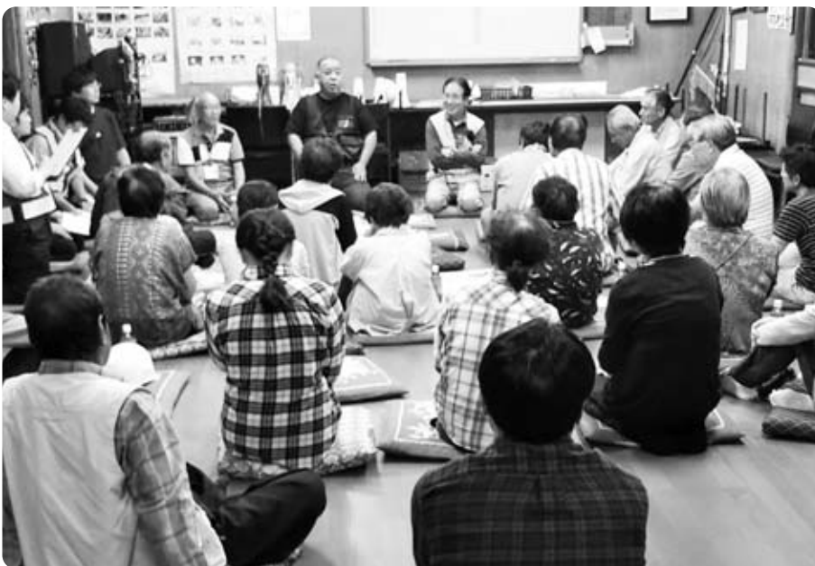
自主防が真剣に取り組む鯉沢中区(上北町)の防災講座

問 30年3月の児童虐待死事件を受け、国は緊急対策を実施した。本町の現状と推移・対応は、 子育て支援課長 29年度の相談対応件数は16件。例年同じくらいの件数。まず担当課で安否確認をし、個別ケース会議で検討し対応している。 問 大変に深刻な問題だ。