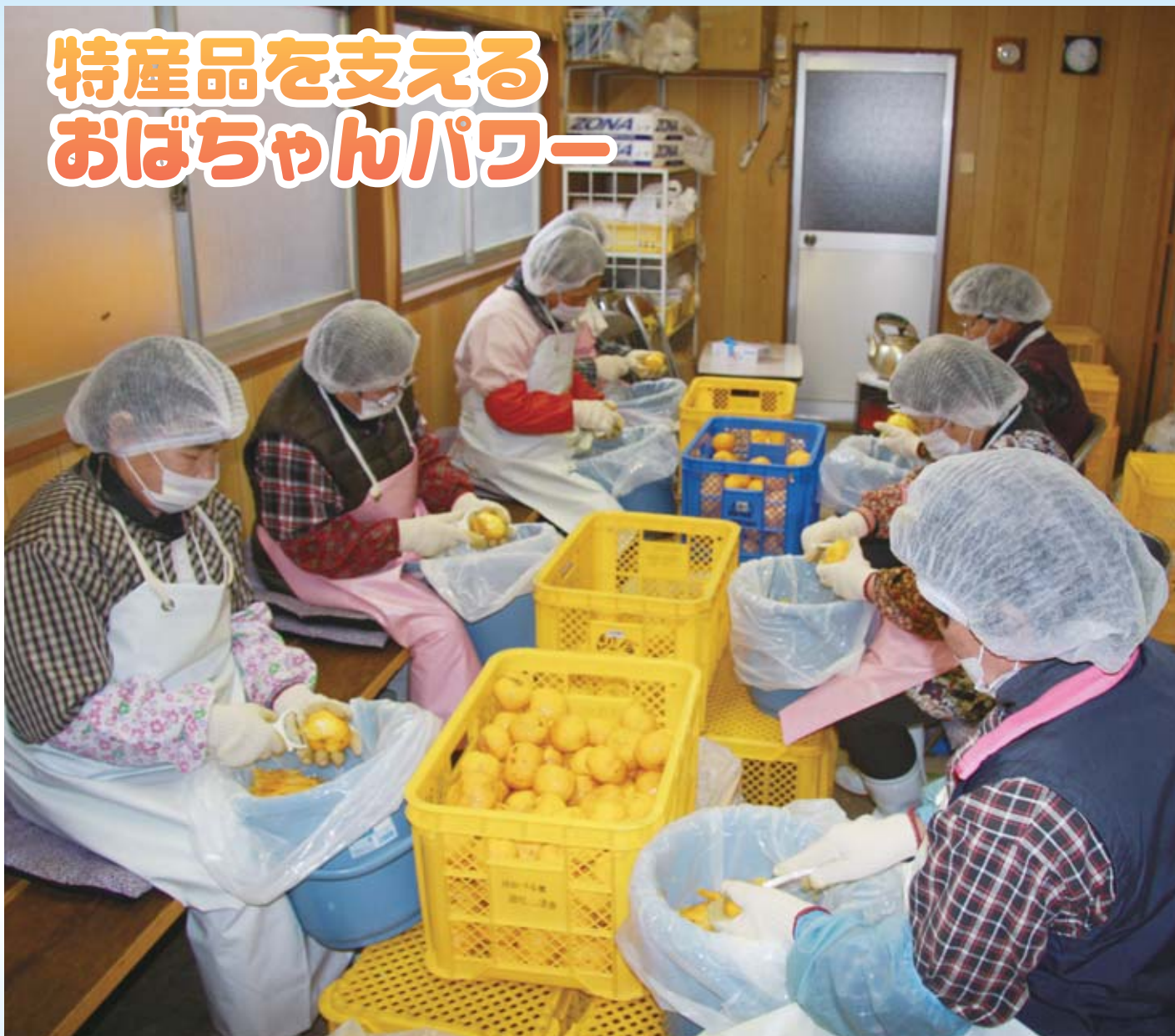
ゆずの皮むき作業(日出づる里活性化組合・穂積区)