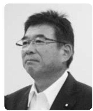
秋山 仁 議員