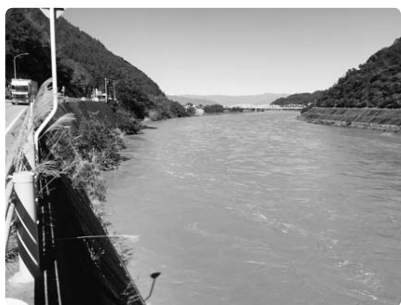
かつて賑わいをみせた鰻沢河岸

問 富士川舟運の遺物、写真、資料などを1カ所に収集展示の予定があるか。 生涯学習課長 社会の変遷や生活環境の変化を知る上で、大切なことと認識している。歴史的な価値がある資料などの調査を行い、町の資料も含めた集約展示が可能か検討していく。