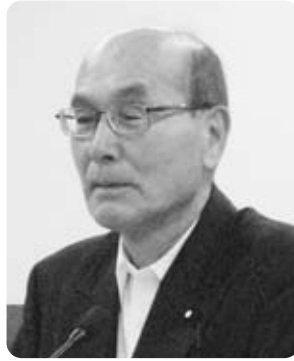
成田 守 議員