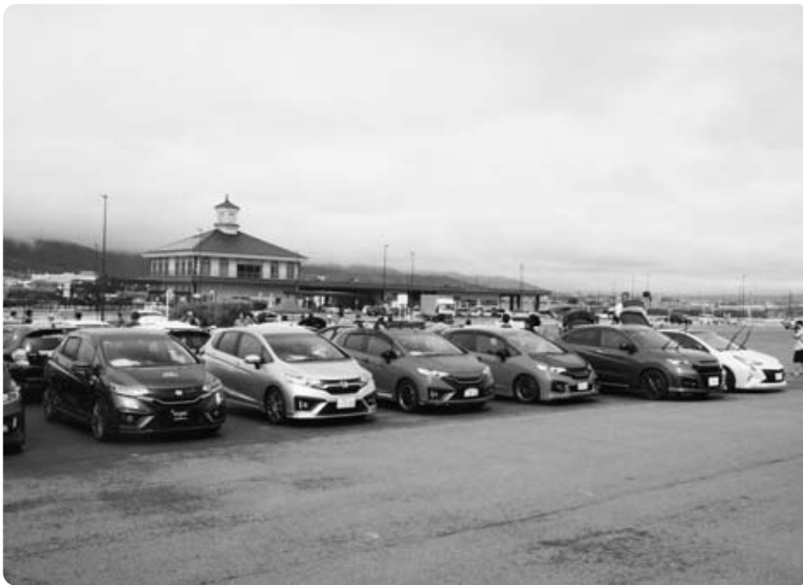
富士川町の玄関口「道の駅 富士川」

問 町制施行10周年記念事業の計画は。 政策秘書課長 富士川町は平成22年3月に誕生し、平成32年3月8日に10周年の節目を迎える。平成31年度を記念の年と位置付け、