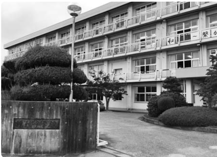
築47年の増穂中学校

問 役場庁舎整備検討委員会の議事録は、新庁舎建設から入っている。耐震化やリノベーション、一部新築などの意見はない。改めて新庁舎建設の必要性は。