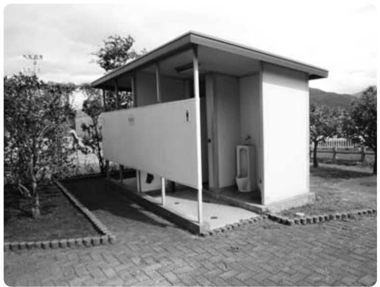
テニスコート隣接トイレ

イレを利用してはいるが、評判が良くない。トイレの改修計画は。 都市整備課長 昭和63年3月に整備されたもので、老朽化が進んでいることは認識している。公園やテニスコート利用者のニーズに対応した計画も必要と考える。国の交付金事業を検討する中で、トイレを含めた公園施設の改築を進めていく。