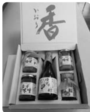
ふるさと納税返礼品の一例

答 寄附全体では3172件、4132万5700円で、返礼品および送料などに要した経費は、1656万2200円であった。納税額に占める返礼品や事務費などの経費割合は約4割である。