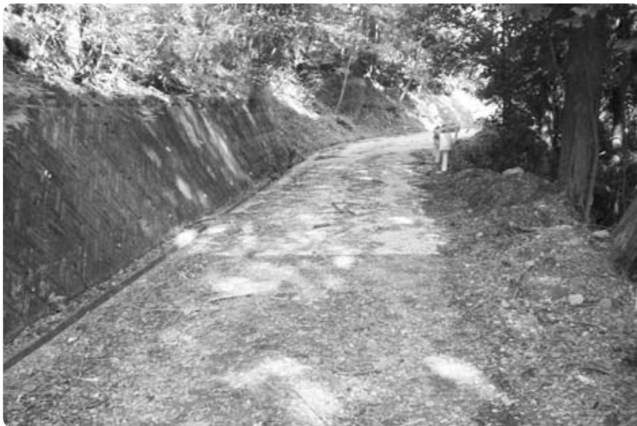
北山林道整備状況

福祉保健課長 町は名簿の 配布については、初めてで ある。各区にはそれぞれの 方法がある。配布方法を検 討する中で意見を伺い、今 後については改善を行う。