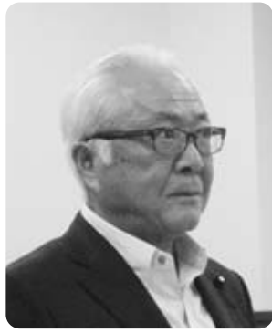
秋山 稔 議員