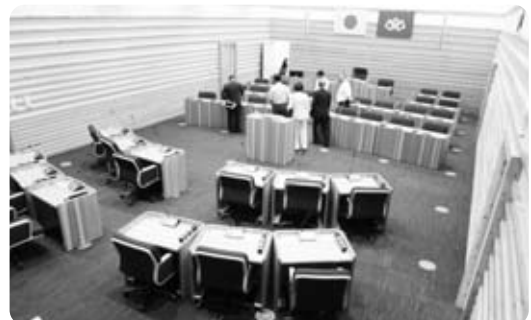
地元木材を利用した国見町役場議事堂

国見町は福島県最北部に位置し、西に山形県、東に宮城県県境の町です。人口は富士川町より少なく約9300人で、生産果実は桃・ぶどう・ラフランスなどと似ています。2011年の東日本大震災で役場庁舎が大きく被災したため、復興債を費やして新築しました。「国産木材を多く使用し、暖かみのある木質建築」と「木材をふんだんに使用した議事堂」などが、今回の視察目的でした。研修後の感想などを、ぜひ各議員にお尋ねください。