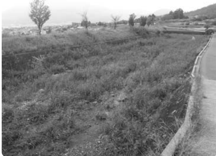
天井川となる新利根川の防災対策を