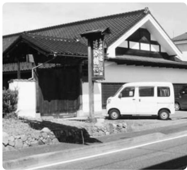
活用を求められる青柳宿

問 新庁舎建設によって町民の生活、庁舎で働く職員たちの行政サービスがどう変化するのか。