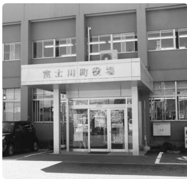
耐震性を問われる役場庁舎