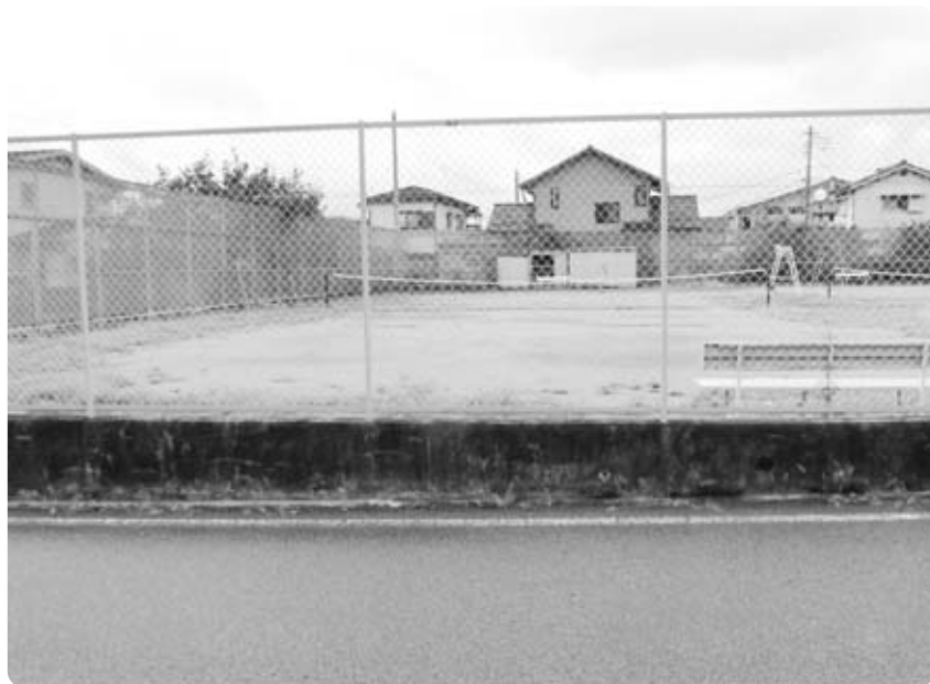
砂ぼこりが問題の増穂中学校テニスコート

【その他の質問】 ・増穂商業高校跡地に社会を支える職業人材を育成する高等教育機関の設置の公約について