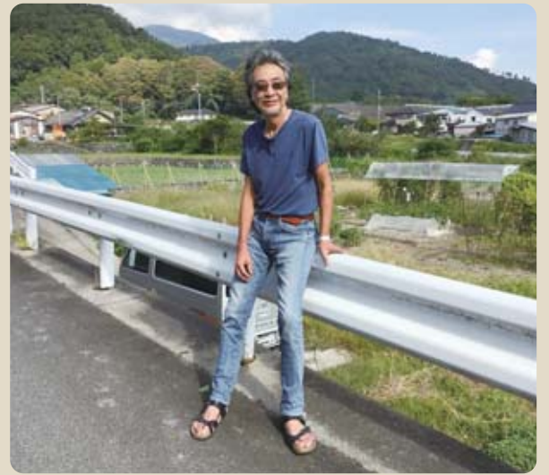
休日にはのんびりしま～す