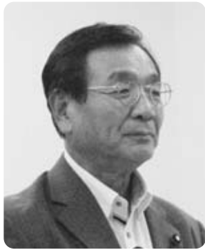
望月 眞 議員