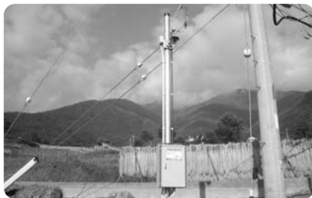
防犯対策に活躍(平林地区)