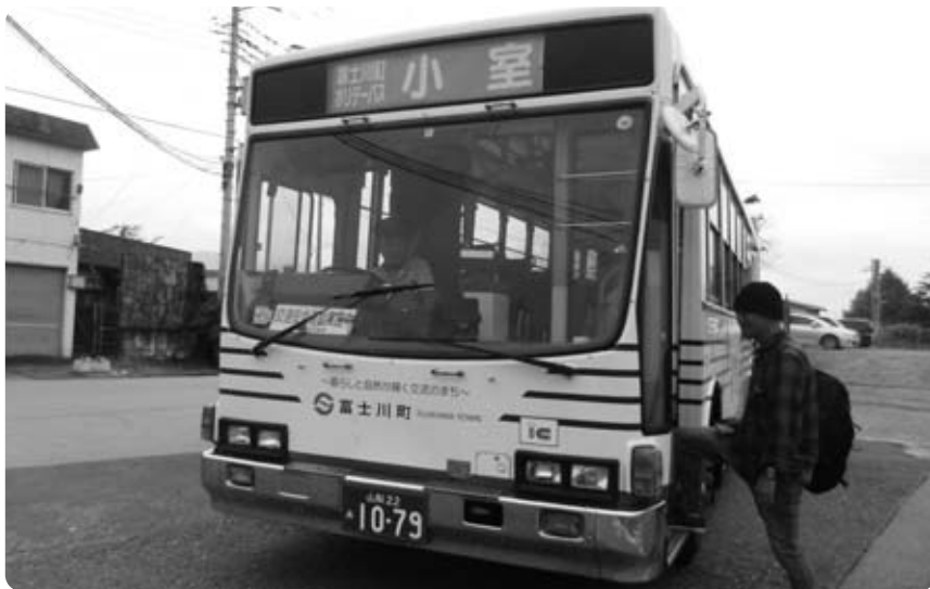
ホリデーバス運行に使われているP-LV314Kバス (大阪府高石市からの観光客) 国内で2路線しか走っていない珍しいバスで 日本各地のバスマニアが乗車・撮影に訪れている

問 コミュニティバスは、市川三郷町役場付近まで運行延長を申請したらどうか。 政策秘書課長 市川三郷町内に新設校が開設されることにより、本町から通学する生徒が見込まれる。路線延長には運輸局へ申請して