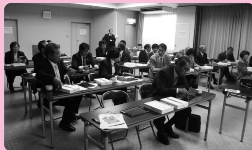
体験操作が行われたタブレット研修