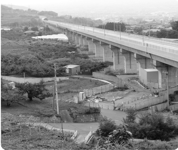
リニア実験線（笛吹市内の状況）

問 以前、説明会の中でその側道は中央市の駅までということ、新しい交通網として有効だと感じたが、その後、中央市・南アルプス市はそれについて見送るような話を聞