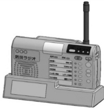
助成対象の台座型文字表示機 (イメージ図)

る方が購入する場合には、3分の2(11,000円)、身体障害者手帳を持っていない方には2分の1(8,000円)程度の補助を考えている。