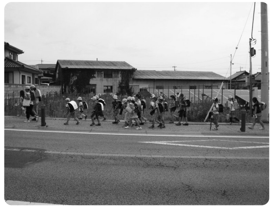
多くの小学生が登下校に利用する昭和通り

てあげなければならぬと考えているか。この道路は小学生にとつて非常に危険率が高い。道路整備を中止する考えはあるか。