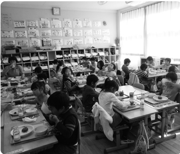
負担軽減が求められている給食費

町長 子育て支援課を新設して5年目となる。こども医療費の窓口無料化、不妊治療費や予防接種の助成、保育料の軽減等、さまざまな子育て支援の政策を打ち出し、子育て家庭への支援につなげてきた。