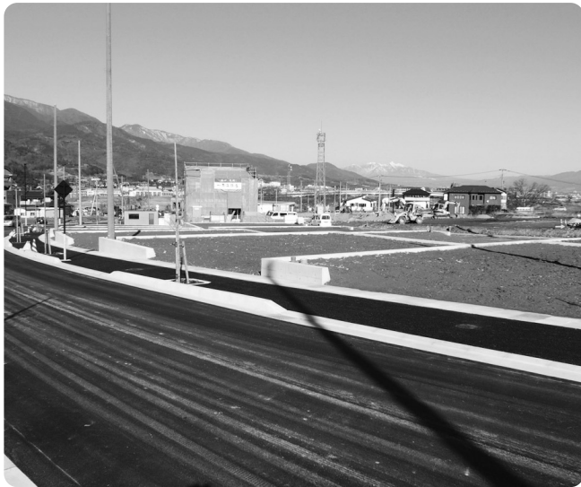
人口増に期待（駅前通り山王地区）

問 中山間地等における住宅用地取得補助金交付として80万円を限度に3分の1以内の補助を予定しているが、中山間地等以外においても定住促進対策の考えがあるか伺う。