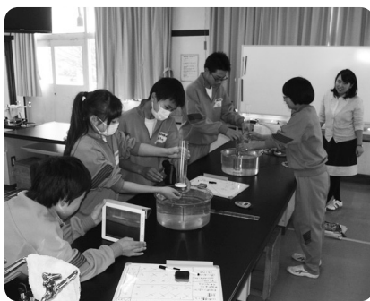
タブレットを使っでの授業(増中)

教育長 教員が教材研究をしつかりして、授業を行うことがベースである。それに伴い、補助教材としてタブレットなどを使う中で、子どもたちの理解を深めていくことが必要。校長会と