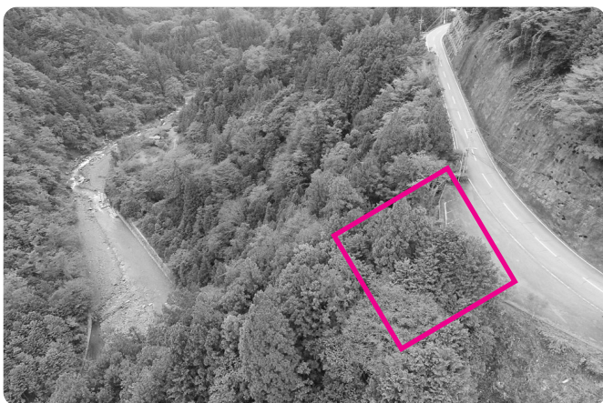
十谷ヘリポート建設地