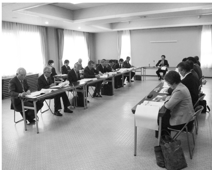
経営統括プランの説明会

国会では議員立法が可決され、鯉沢病院についても存続の可能性が見えてきました。しかし、医師の確保や経営再建など、中身に関しては全く具体的な方針が示されておらず、不安材料は山積しています。