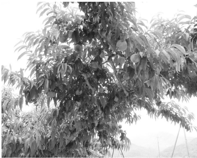
農業の再生と振興は

した、ふれあいの郷づくりについて、農村資源を生かした交流体験施設整備や、農村情報の発信を進める。