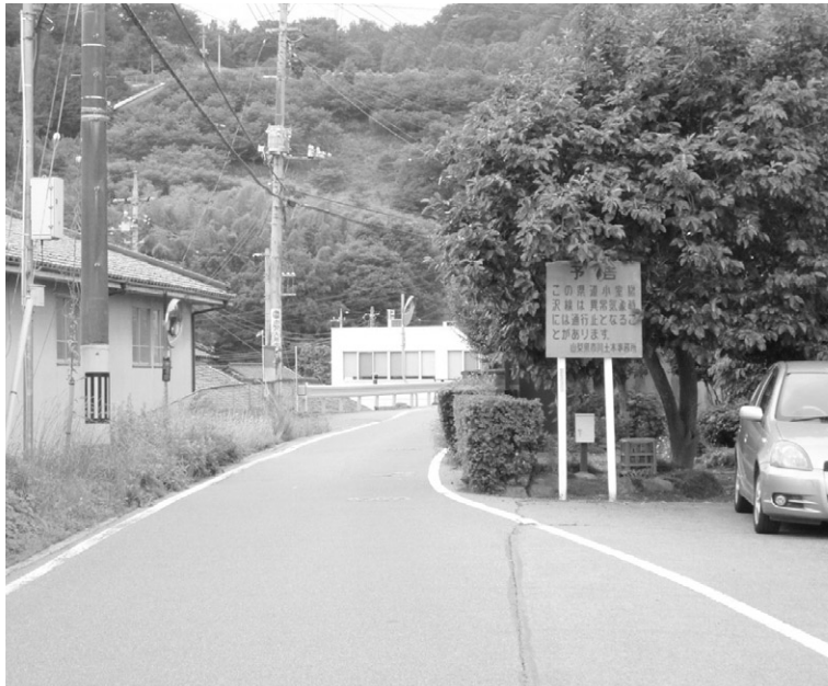
拡張が難しい県道