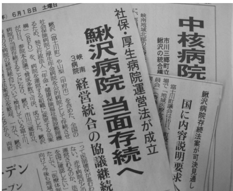
医療は国の責任で

一昨年売却から存続へと方針転換した法案が提案されたが、首相の辞任で廃案となった。こうした中、峡南北部地域の医療のあり方を調査検討をしてきた。先ごろ、調査検討委員会が検討結果案をまとめたが、その一方でRFOを施設などの整理統合を目的とした組