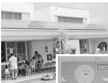
ピカリコ 1 発電所(第1保育所)