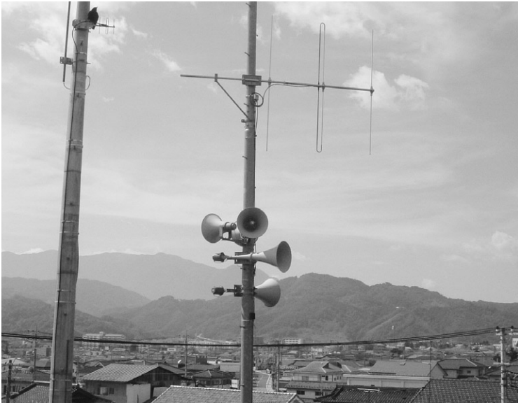
課題が残る難聴地域