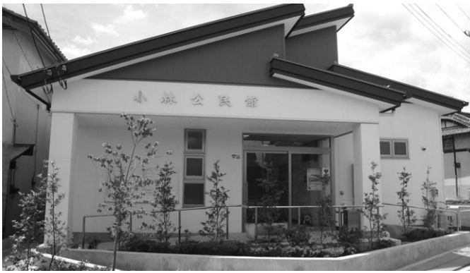
新しくなった小林公民館

人口に1万円を乗じた金額を補助している。 新築については多額の費用を要するので、準備が整つ