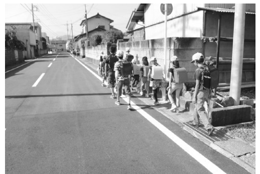
安全な通学路の確保を

問 町道最勝寺小林2号線は、通学路として利用しているが歩道がなく危険。 建設課長 当該路線沿いは家並みが続いており、歩道設置は現状では困難。 問 歩道線を広げ、側溝に蓋をかけ、緑色に塗るなどの安全対策ができないか。 建設課長 車道を狭くしてカラー舗装を行うには、地元地域の合意が必要。学校や地区で話し合いを重ね、町に要望してほしい。 問 他にも通学路に歩道がない道路が多々ある。調査・検討し歩道設置ができるか。 総務課長 通学路の危険個所について調査を続ける。危険個所は、関係団体と相談し対応する。