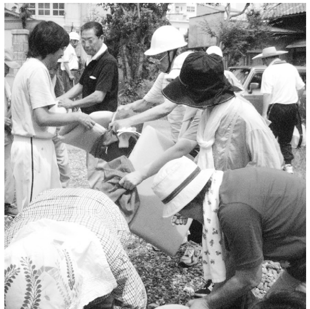
備蓄品を整備する自主防災活動

の地震が発生した場合は、保護者の迎えによる帰宅となる。保護者が迎えに來れない場合には、生徒は学校で待機するため、非常用の食料を備蓄している。