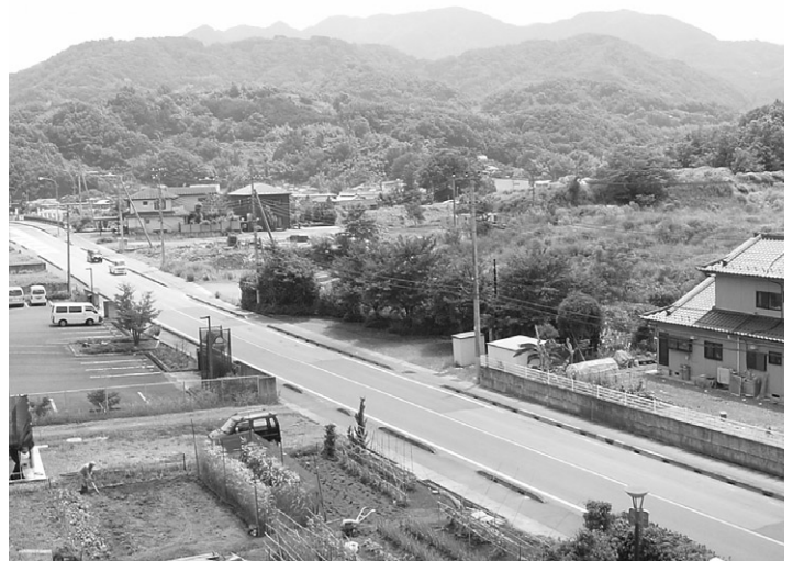
山王土地区画整理予定地（駅前通り2丁目）

町長 富士川町では詳細は決まっていないが、仮に1人出して、年間500万円の給料だとすると、2千万円かかる。