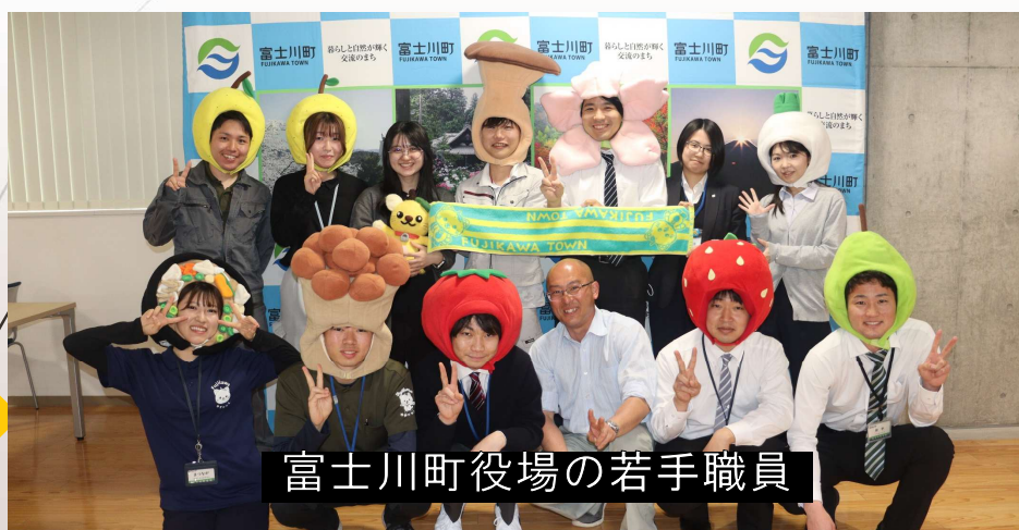
富士川町役場の若手職員