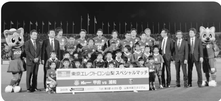
▲ヴァンフォーレ甲府の選手と記念撮影をするエスコートキッズ(増穂サッカークラブ)

4月29日(水・昭和の日)、ホームタウン富士川町サンクスデーが開催されました。スタジアム内では鰻沢ばやし保存会が応援パフォーマンスで盛り上げ(表紙)、スタジアムの外では、増穂商業高校の「いきいきショップ増商」が出店し、生徒が考案したラ・フランスジャムのパンやゆずマドレーヌなど、町観光物産協会ではねじり菓子と小麦まんじゅうを販売しました。リーグ戦では9年振りに浦和レッズを中銀スタジアムに迎え、ヴァンフォーレ甲府の勝利を願っていましたが、惜しくも0-2で負けてしまいました。これからも、ヴァンフォーレ甲府をみんなで応援しましょう。