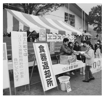
▲甲州富士川まつりのリユース 食器返却所

昨年の「甲州富士川まつり」 でも多くのリユース食器が利用 されました。その結果、排出さ れたゴミは51kg（生ごみは堆肥 化処理）。ほかの市町村のイベン トにはみられない、わずかな量 のゴミでした。