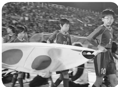
◀ボールパーソン(左上)、フェアプレイフラッグ(右上)、エコパナーキッズ(左)を務めた増穂サッカークラブ