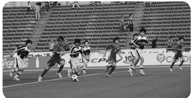
▲キッズチャレンジマッチ 増穂サッカークラブ対道志トルベジーノジュニア