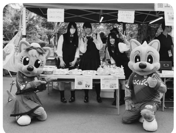
▲「いきいきショップ増商」にヴァンくん(右)とフォーレちゃん(左)が来てくれました。