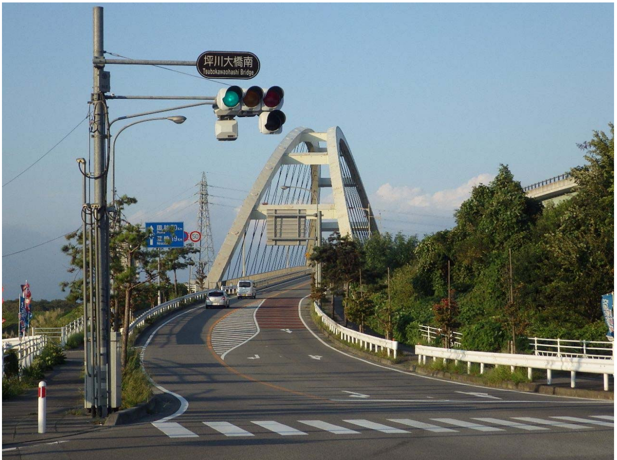
・甲西道路と坪川大橋